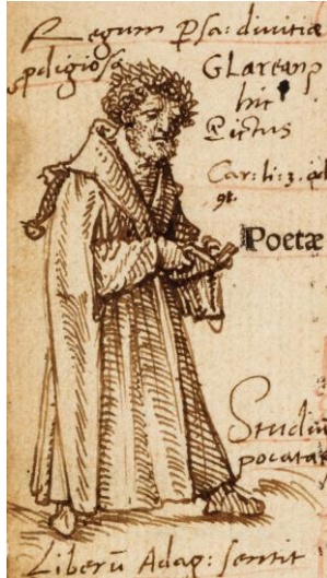
Heinrich Glareanus, dessiné par Hans Holbein le Jeune